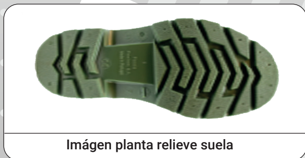
Imágen planta relieve suela

Distribuidor: Marca Protección Laboral S.L.