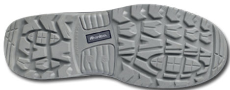
Imagen planta relieve suela

Fabricante: Marca Protección Laboral S.L.