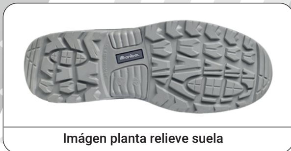
Imágen planta relieve suela