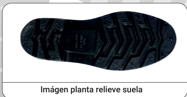
Imagen planta relieve suela

Distribuidor: Marca Protección Laboral S.L.